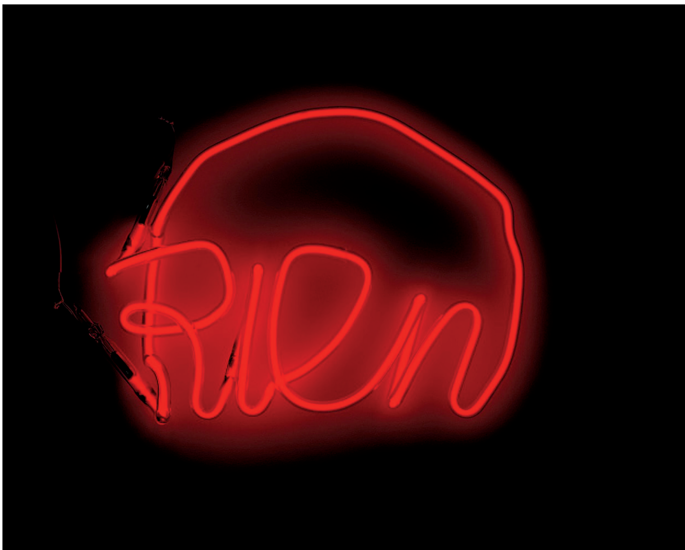
Jean-Michel Alberola, Rien , 1995, néon et plexiglas, 26 X 36 cm, collection de l'artiste