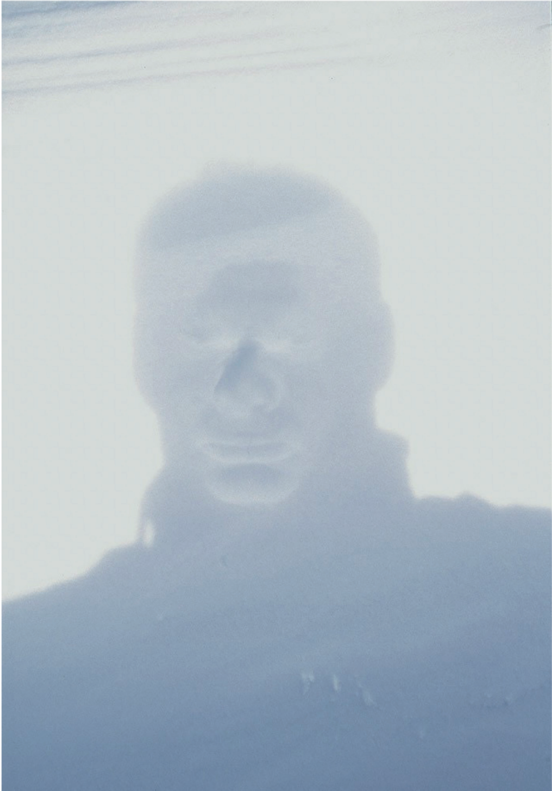
Peter Callesen, photo d'une œuvre éphémère intitulée Snow Print , 2001, 50 x 70 cm pour l'oeuvre, 70 x 100 cm pour la photographie