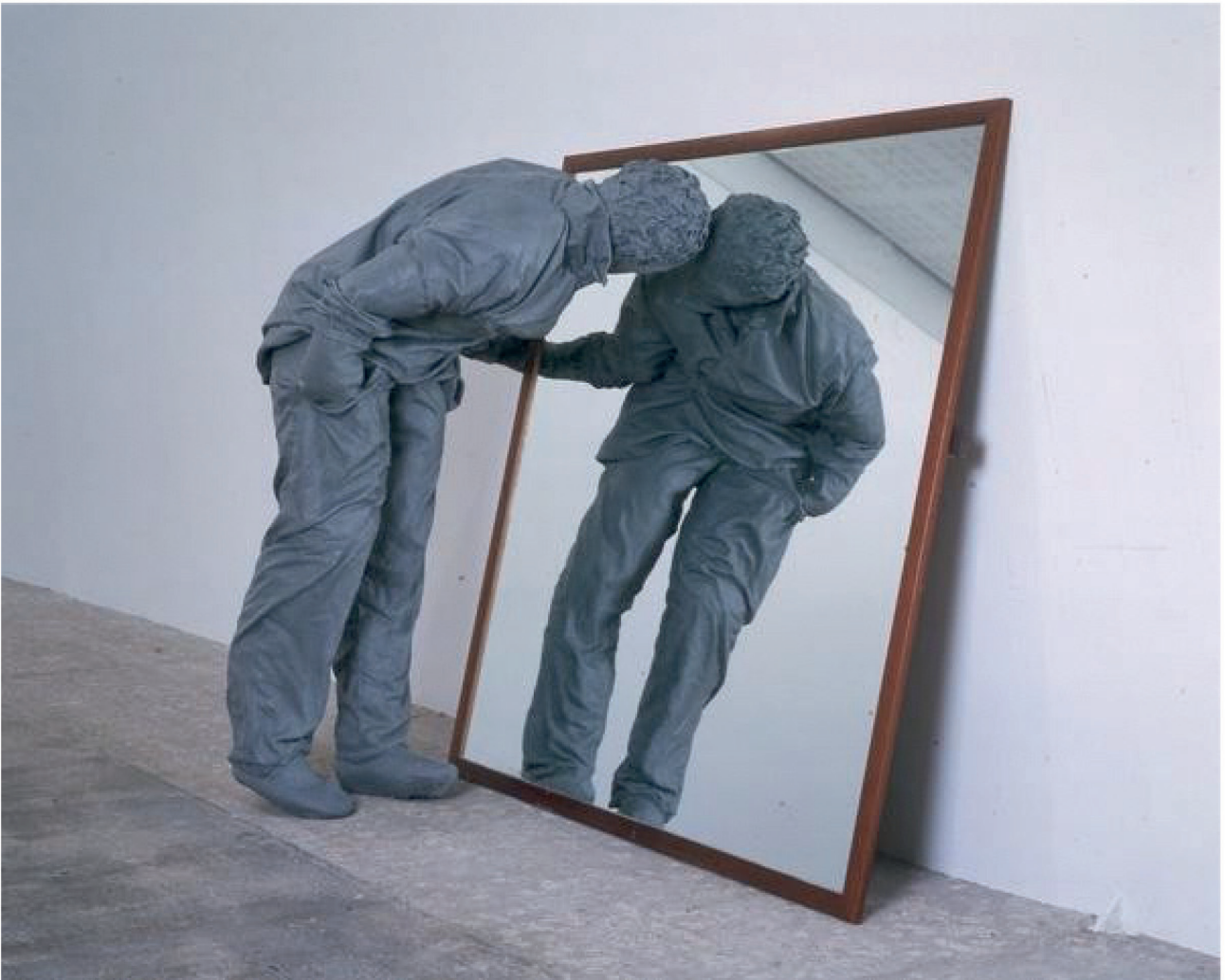
Juan Muñoz, One figure , 2000, résine de polyester, miroir, 110 x 60 x 50 cm, Musée de Grenoble