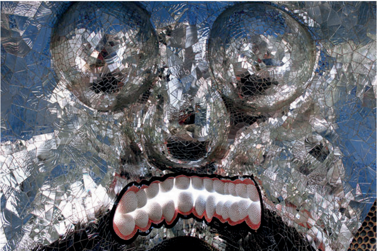
Niki de Saint Phalle, La Cabeza , 2000, matériaux divers, 366 × 427 × 366 cm, Niki Charitable Art Foundation, Santee, Californie