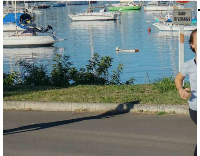
Les coureurs en zone militaire ont une belle vue sur la mer