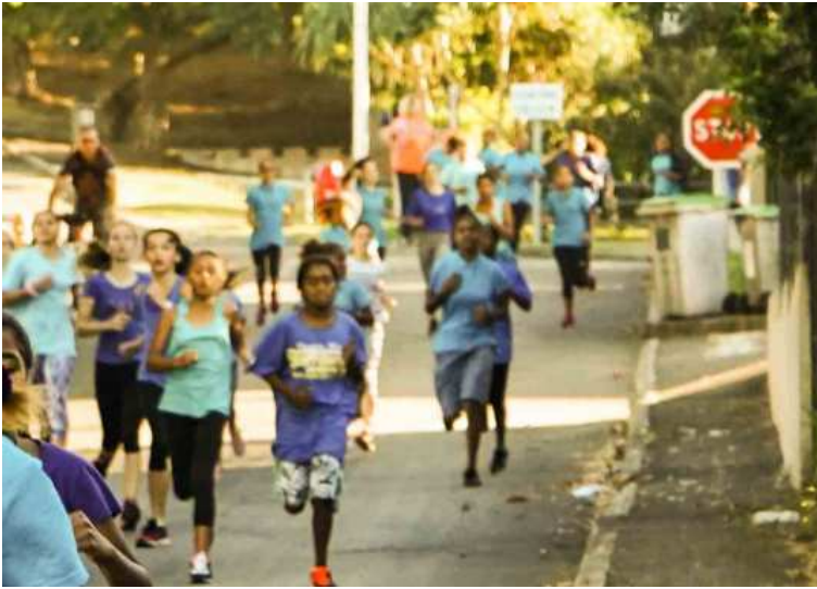
Les 5ème filles sont allées très vite.