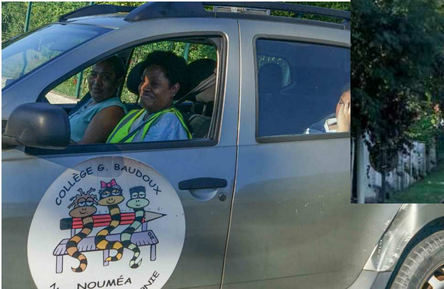
Les élèves qui ne se sentaient pas bien ont été évacués dans la voiture du collège