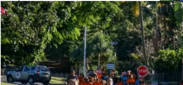
Pour leur premier cross de collégiens les 6ème sont à fond !